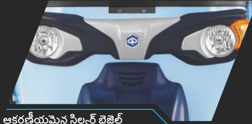
ఆకర్షణీయమైన సిల్వర్ బెజెల్