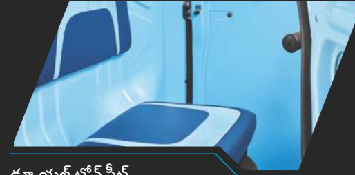
డ్యూయల్ టోన్ సీట్స్