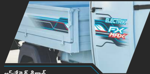
అప్ గ్రేడెడ్ డికాల్ప్